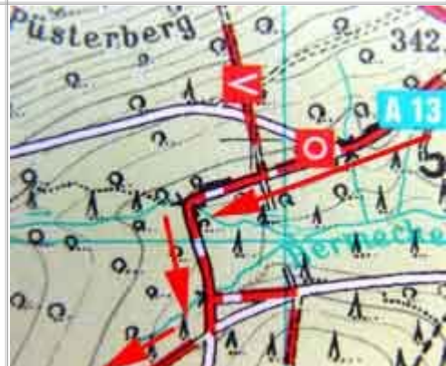
Bild: Weg A13 kreuzt den Dahlborn

Achtung! Eine kritische Stelle. Bitte genau die Karte beachten.