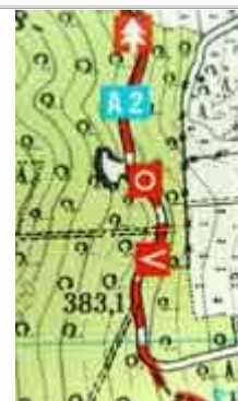
Bild: Blick auf Warstein

Nach ca. einem km haben wir einen herrlichen Panoramablick auf die Stadt Warstein mit der alten Kirche.