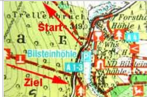
Bild: Verschiedene weitere Attraktionen im Bilsteintal laden Sie ein, wieder zu kommen.

auf dem A 2 weiter zu gehen bis zum Ausgangspunkt am Höhlenparkplatz.