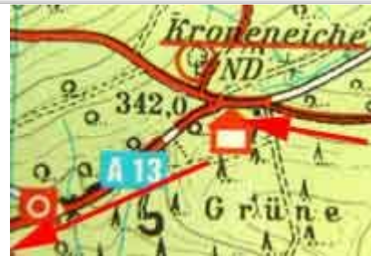
Bild: Weg A13 nach ca. 500 m

Achtung! Vom Karl-Piper-Platz am Wegerondell den ersten Weg links einbiegen