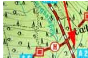
Bild Wegegabelung A16 / A2

zwischen A 16 u. A 2. Beide Wege verlaufen nun zusammen - also weiter auf A16 / A2.