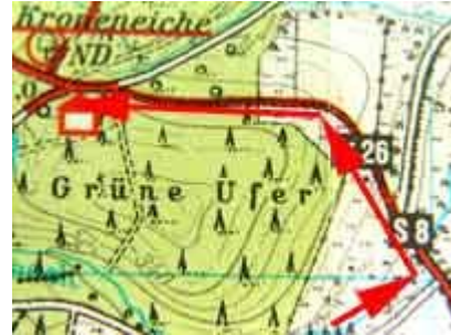
Bild: Die letzte der einst stolzen Kroneichen.

Hier ist eine historische Versammlungsstätte der Warsteiner Sozialdemokraten, die sich hier unter den ca. 300 Jahre alten Eichen heimlich in der NS-Zeit versammelten.