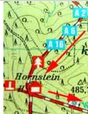
Bild: Der Hornstein, eine schön anzusehende Schichtung des Kalkgesteins.

Wir gehen weiter am alten Kulmsteinbruch vorbei bis zum Hornstein und biegen hier nach links in den Waldlehrpfad A2 ein.