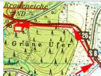
Bild: Biohof Matern am Grünen Ufer.

Am Biohofladen vorbei folgen wir dem Wiesenweg wieder NW auf den Wald zu. S8, X26