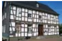
Bild: Das aus dem frühen 19. Jahrh. stammende Haus Seißenschmidt ist die Vikarie der Gemeinde. Der sich nach hinten erstreckende Neubau dient als Jugendheim.

Weg: der Weg führt entlang der Mauer zurück. Geradeaus liegt die Alte Volksschule.