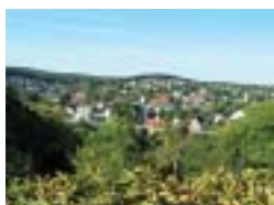
Bild: Reste der Stadtmauer gehen auf die Zeit der Stadtgründung 1296 zurück. Nach dem großen Stadtbrand 1805 wurden auch Steine der Stadtmauer zum Wiederaufbau der Häuser verwendet.

Weg: am Wegekreuz vorbei bis zur Propstei