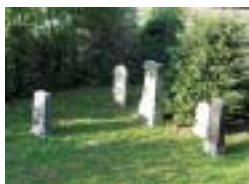
Bild: Am Fußweg liegen zwei weitere Sehenswürdigkeiten. Eine Bank gibt ggf. Gelegenheit zu einer Verschnaufpause.

Weg: rechts am Mühlrad und am Fachwerkhause vorbei bis zu B 55; nach wenigen Metern auf den rechts hochgehenden Fußweg