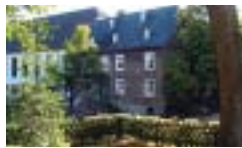
Bild: Das Rathaus wurde nach dem großen Stadtbrand von 1805, in dem 58 Häuser niederbrannten und auch das Inventar des alten Rathauses einschließlich wertvoller Urkunden vernichtet wurde, nach den Vorgaben der hessischen Landesregierung neu errichtet. Zwischenzeitlich diente das Haus als „Petz“ und Asyl für Tippelbrüder. Neben der Feuerspritze stand hier auch der Totenwagen. Heute befinden sich hier eine Heimattube und ein Übungsraum.

Weg: auf der gegenüberliegenden Straßenseite