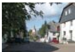
Bild: In dem 1850 mit vier Klassenräumen errichteten Schulgebäude wurde bis zum Jahr 1954 unterrichtet.

Weg: die erreichte Straße Am Propsteiberg führt durch eine Senke.