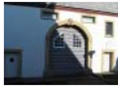
Bild: Die ehemals dem Kloster Grafenschaft unterstehende Propstei brannte 1808 ab. Das heutige Pfarrhaus wurde 1929 errichtet. Die Verbindung zur Abtei wird mit den Buchstaben M und G (Monasterium Grafenschaft) im Wappen über der Eingangstür verdeutlicht.

Weg: am Querhaus des Propsteigebäudes vorbei