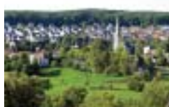
Bild: Auffallend ist das rechtwinklig angelegte Straßenbild. Die breiten Straßen ermöglichten ein Nebeneinander von Erntewagen. Die Häuser wurden entlang der Grundstücksgrenzen errichtet.

Weg: zwischen den Häusern Am Propsteiberg ergeben sich immer wieder schöne Blicke in das Tal.