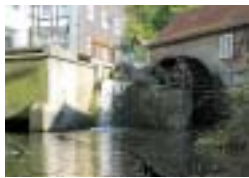
Bild: Im Mühlengraben wird ein Teil des 200 m oberhalb abgeleiteten Wassers der Wester gestaut und über ein Leitblech auf die Schaufeln des Wasserrades geleitet. Bis 1958 wurde auch eine Turbine zur Erzeugung elektrischen Stroms für die Kornmühle betrieben.