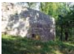
Bild: der Judenfriedhof. Der jüdischen Friedhof befindet sich im Eigentum des Landesverbandes der Jüdischen Kultusgemeinde von Westfalen in Dortmund. Die Pflege wird durch die Stadt Warstein durchgeführt.